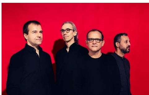
Anouar Brahem (oud)

20h00 HEMU Jazz Orchestra feat. Ayekoo Drummers of Ghana 21h45 Anouar Brahem Quartet