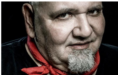
Popa Chubby (g, voc)