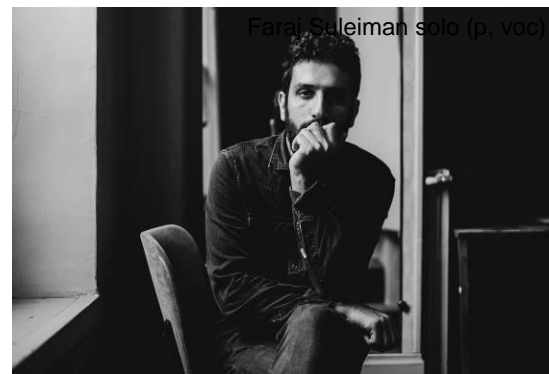
Faraj Suleiman (p, voc)

Considéré comme l'un des compositeurs les plus talentueux du moment, Faraj Suleiman triomphe partout où il va avec ses compositions originales influencées par les cultures arabe et orientale. Mettant le piano au centre de ses œuvres, ce pianiste de génie réussit l'exploit de transmettre toutes ses racines du bout de ses doigts. Formé à la musique classique, le pianiste palestinien séduit grâce à son savoir-faire unique et sa musicalité hors-norme. Et après tout piano solo au Temple, what else ?